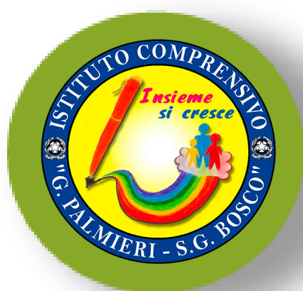
I.C. PALMIERI - BOSCO San Severo

PRESSO SALA ENTE PROVINCIA VIA P. TELESFORO 53 FOGGIA