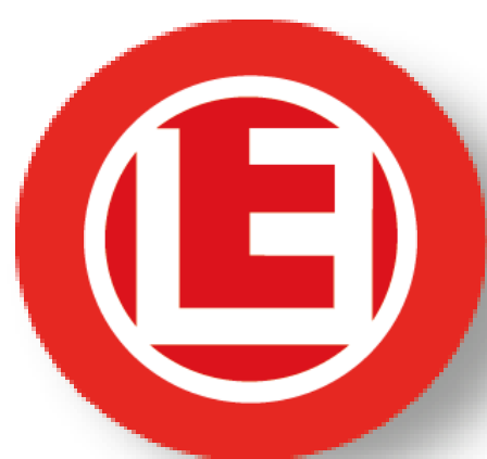
I.I.S.S. EINAUDI Foggia