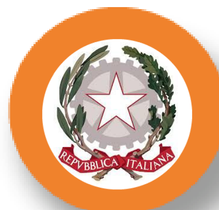
I.I.S. PAVONCELLI Cerignola